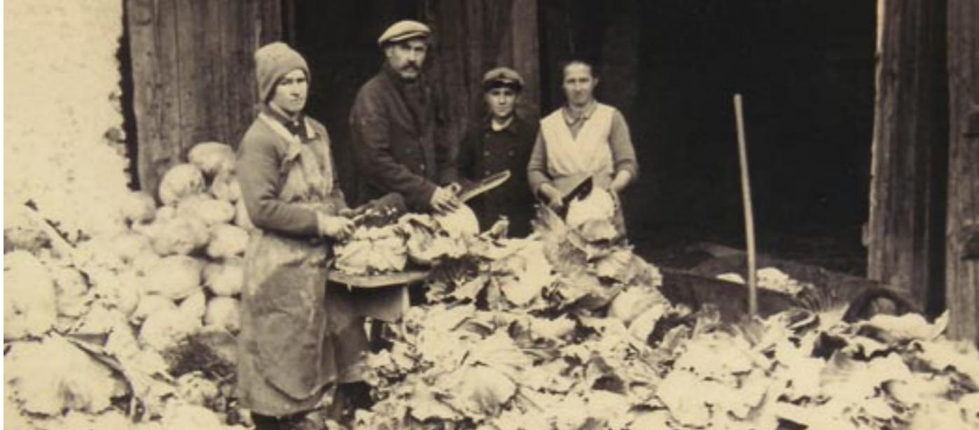
Beim Krautputzen, um 1920.