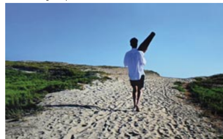
Ein Film zeigt den Künstler, wie er eine selbstgefertigte Karaffe mit Salzwasser in die Berge transportiert.