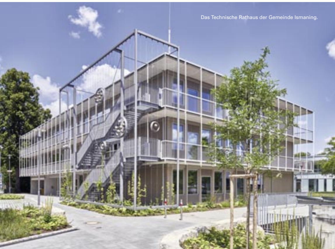
Das Technische Rathaus der Gemeinde Ismaning.

Die Architektouren bieten eine gute Gelegenheit, hinter die Kulissen aktueller Bauprojekte zu blicken und Architektur im direkten Dialog zu erleben.