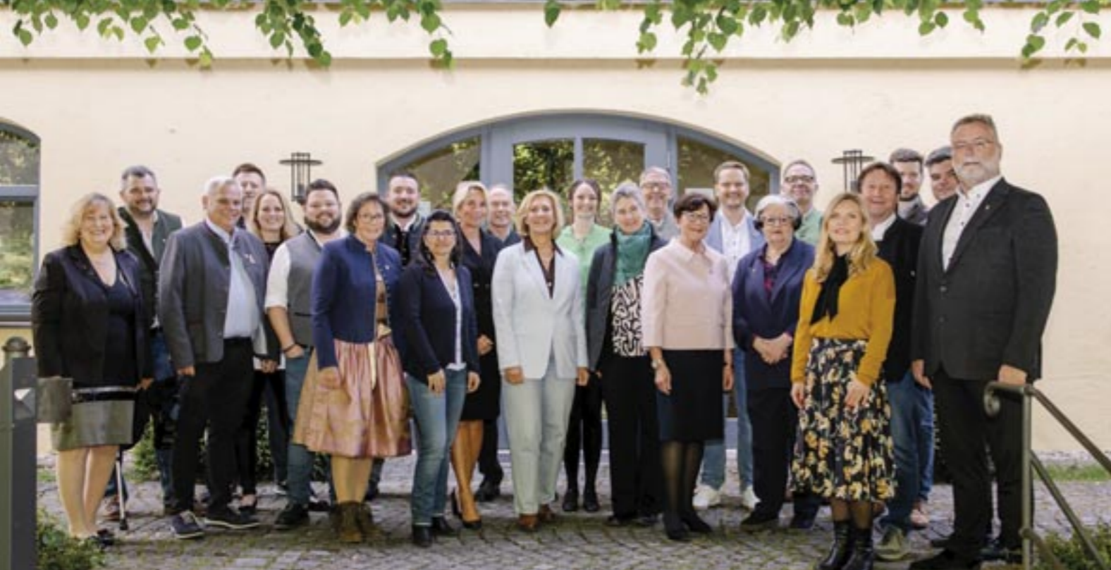
Der neue Ismaninger Gemeinderat.