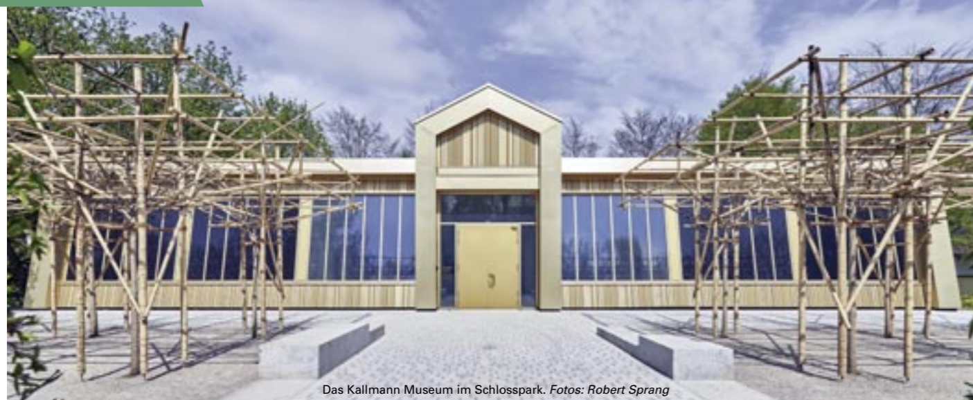
Das Kallmann Museum im Schlosspark.