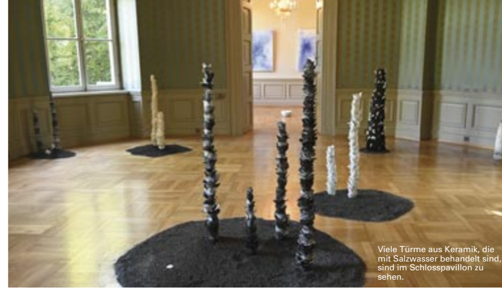
Viele Türme aus Keramik, die mit Salzwasser behandelt sind, sind im Schlosspavillon zu sehen.