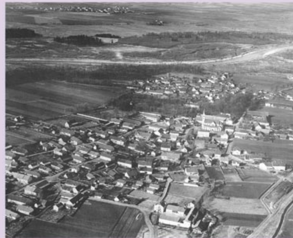
Das älteste Luftbild des gesamten Dorfes, um 1918.