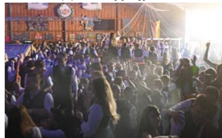
In der Kienasthalle am Sportpark wurde vier Tage gewaltig gefeiert.

Die Kampagne Fairtrade-Towns fördert gezielt den fairen Handel auf kommunaler Ebene. Im Kern geht es dabei um eine erfolgreiche Vernetzung von Personen aus Zivilgesellschaft, Politik und Wirtschaft zur Förderung des fairen Handels. Nicht erst seit der Auszeichnung im Jahr 2021 als Fairtrade-Town trägt die Gemeinde Ismaning soziale Verantwortung und regt die öffentliche Diskussion und Auseinandersetzung mit den Themen Nachhaltigkeit und fairer Handel an. So ist es selbstverständlich, wo möglich, auf faire Produkte und Lebensmittel zurückzugreifen und auch im Rahmen der Europawahl auf das Thema Fairtrade aufmerksam zu machen. Bei Fragen und Anregungen zum Thema Fairtrade freut sich die Gemeinde über Nachrichten per E-Mail an fairtrade@ismaning.de oder per Telefon unter (089) 960900-148 oder -226. Nähere Informationen gibt es auch auf der gemeindlichen Themenseite unter www.ismaning.de/fairtrade .