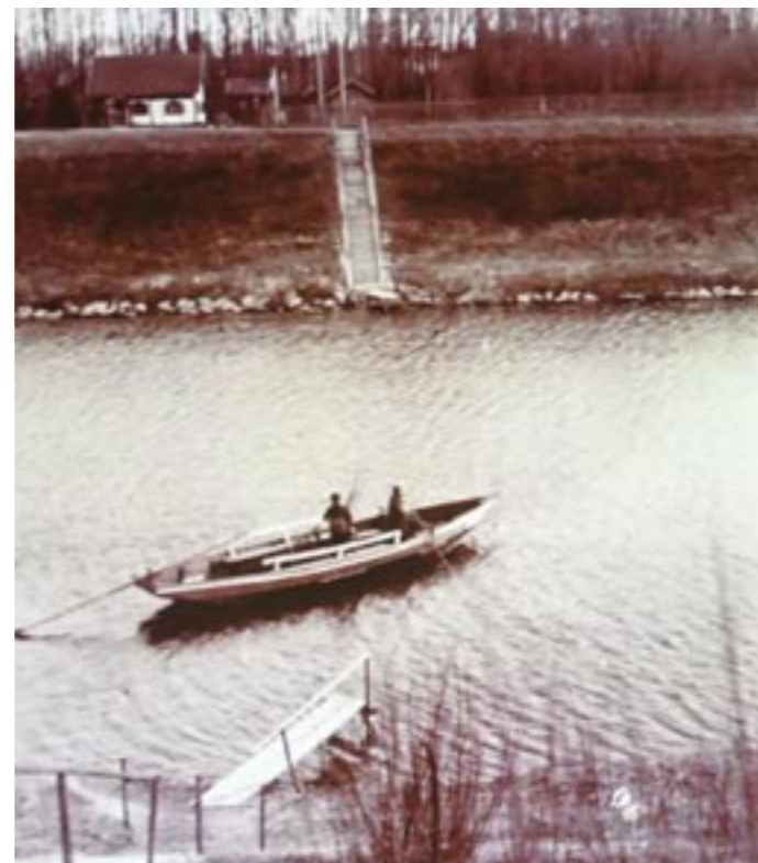
Bis 1960 gab es die Ismaninger Fähre. Im Hintergrund ist das 1950 gebaute Fährhaus (oben links) zu sehen.

York – Hundeschau“. Danach wurde noch von der Eröffnung des Münchner Oktoberfestes berichtet. Maurer erinnerte daran, dass die Wochenschau in einer für die Menschen eher schweren Zeit gute Nachrichten und Optimismus verbreiten wollte. Und so wurde der radelnde Kaminkehrermeister dann berühmt.