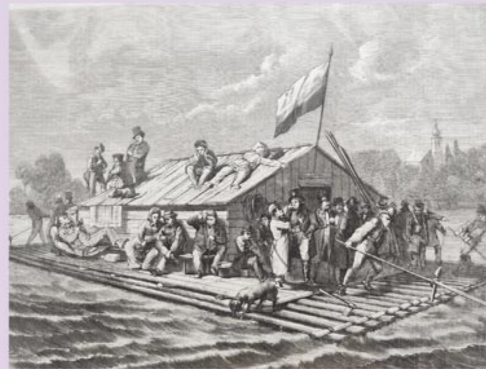
Ordinarifloß nach Wien, um 1880; Schlossmuseum