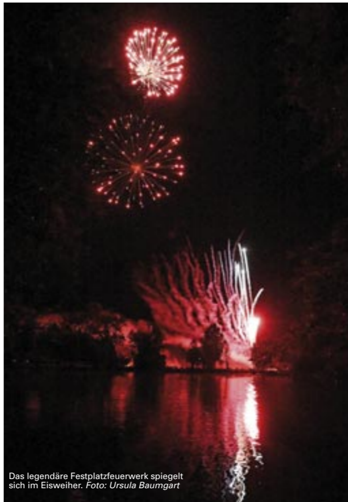
Das legendäre Festplatzfeuerwerk spiegelt sich im Eisweiher.