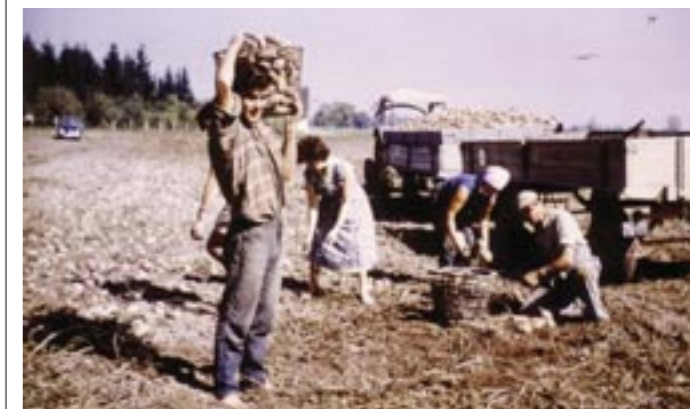
Landwirtschaft war Handarbeit: Kartoffelernte Ende der 1950er Jahre.

Der Hillebrandhof lädt zusammen mit dem Gemeindearchiv Ismaning zu einem offenen Treffen zu verschiedenen Themen ein. Zum nächsten Treffen am Montag, 15. Juli, um 10 Uhr geht es im Hillebrandhof in der Erzählrunde, wie Ismaninger die Veränderung in der Landwirtschaft mit dem zunehmenden Einsatz von Maschinen und Fahrzeugen erlebt haben.